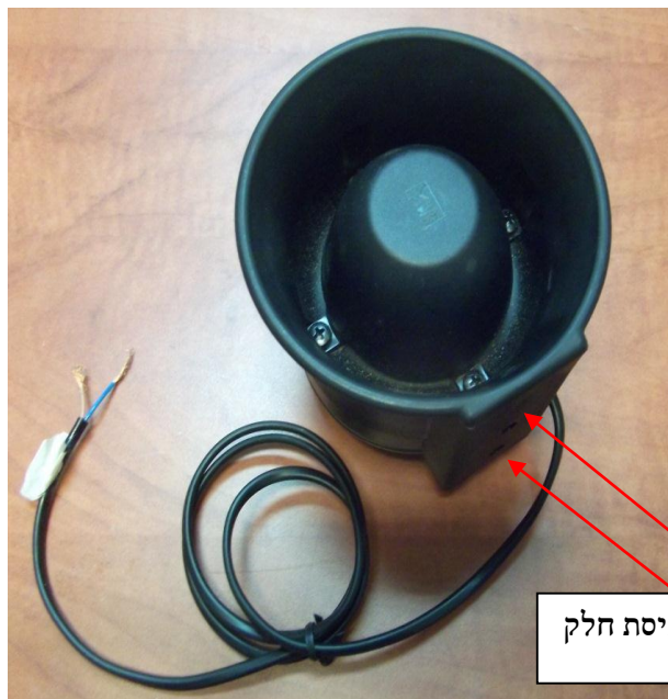
(ד) חורים קבועים על הרמקול לצורך התקנה באופנוע